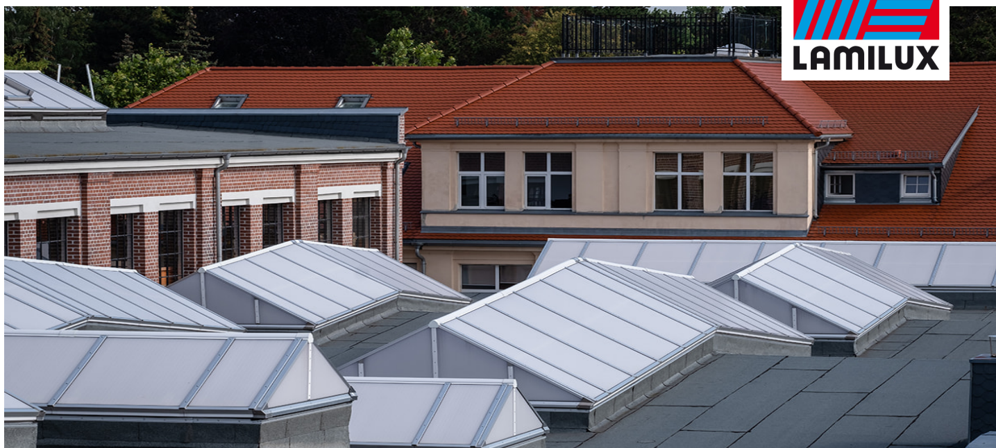
Ehemalige Produktionshalle, Wurzen (Deutschland)