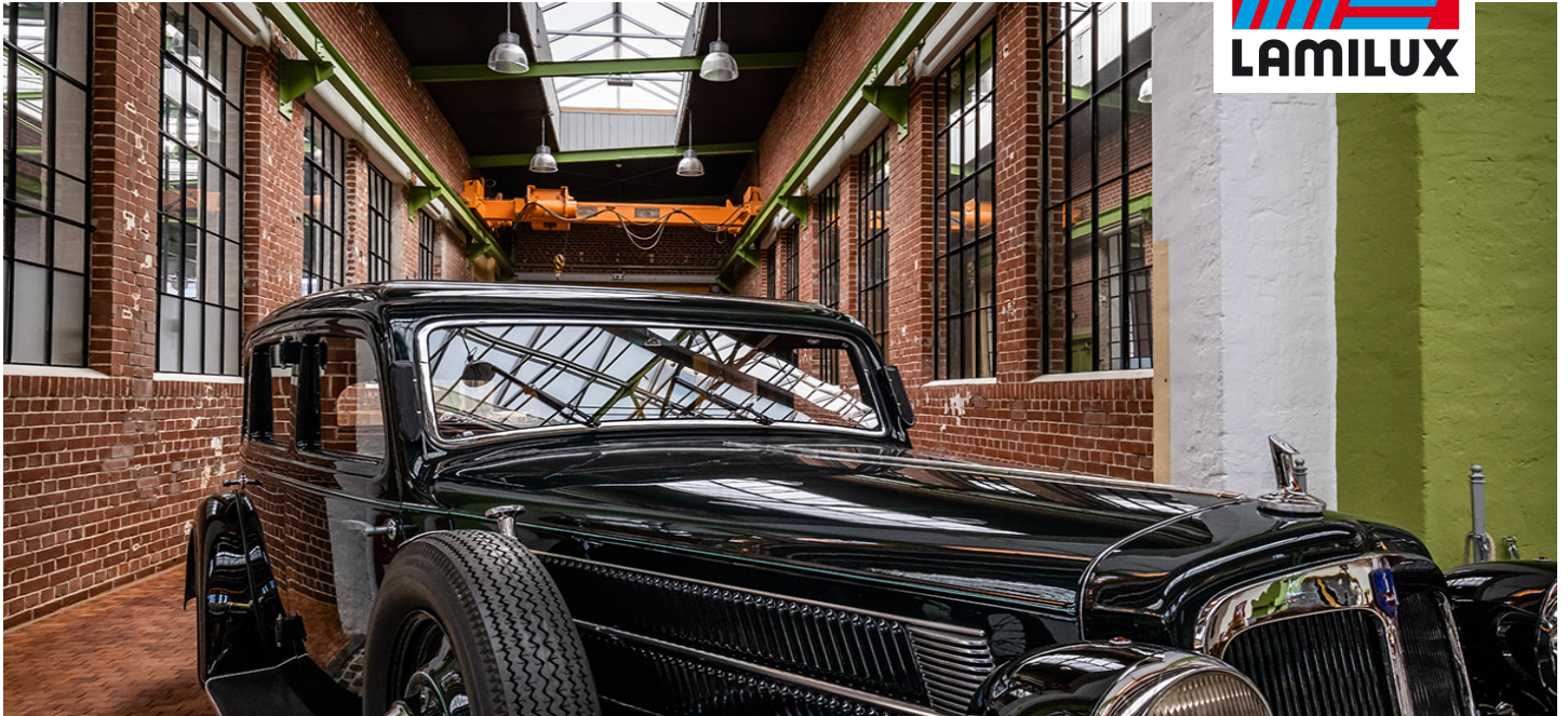
Ehemalige Produktionshalle, Wurzen (Deutschland)