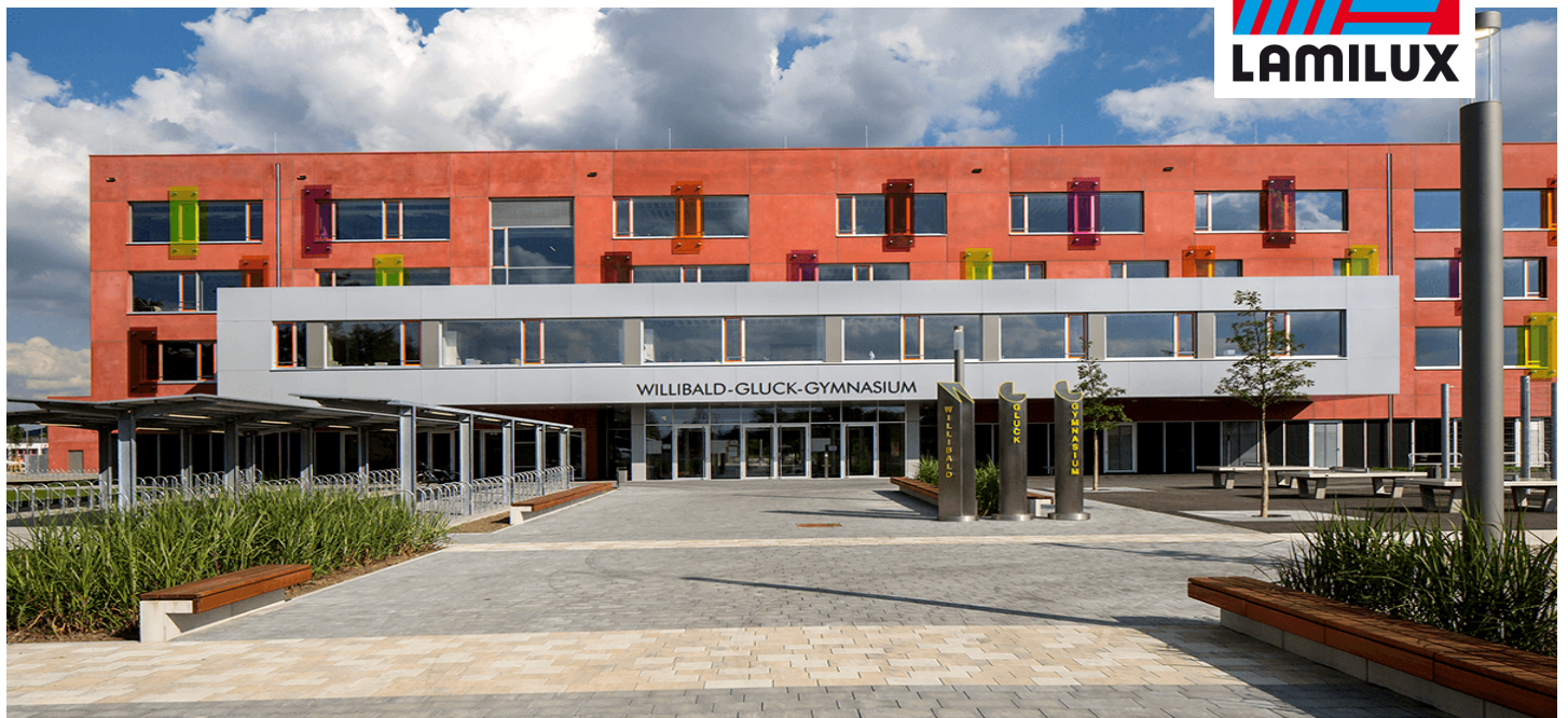
Willibald-Gluck-Gymnasium, Neumarkt i.d. OPf.