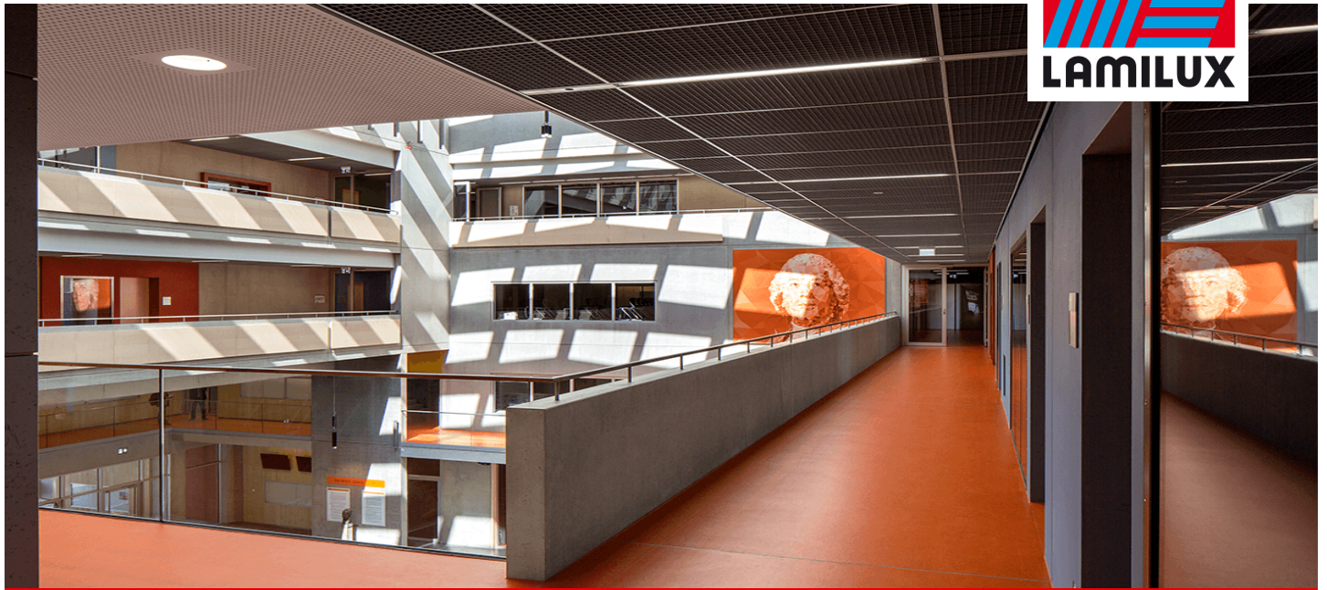
Willibald-Gluck-Gymnasium, Neumarkt i.d. OPf.