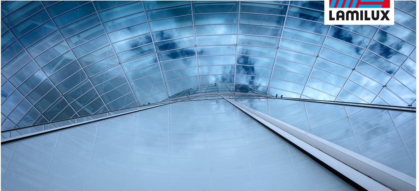
BMW FIZ, München